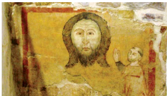
Affresco raffigurante la Sacra Sindone