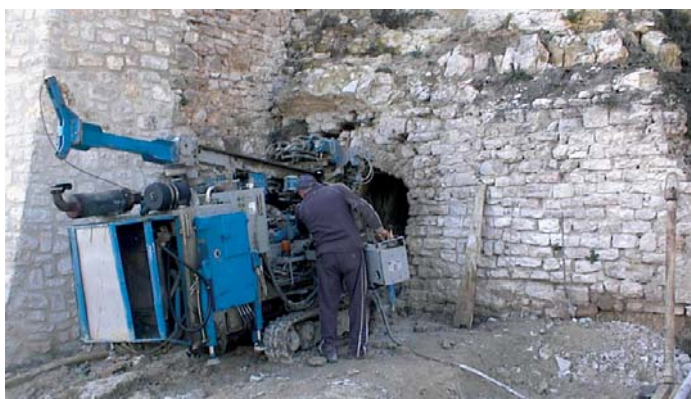
Consolidamento profondo alla base della chiesa