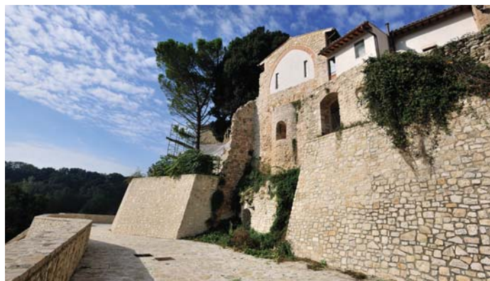
Lato sud della chiesa a lavori ultimati