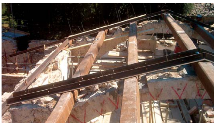
Copertura in legno ed acciaio