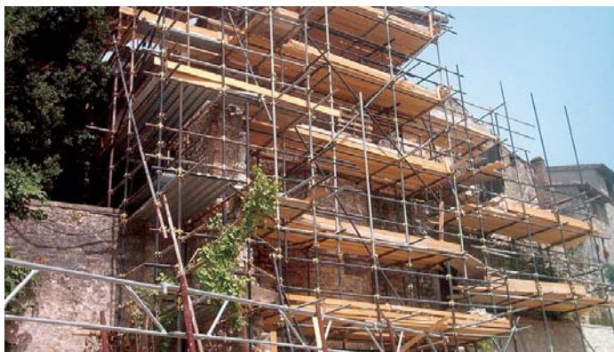
Lato sud della chiesa durante i lavori