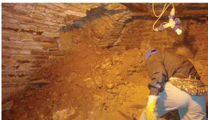
Cripta durante i lavori