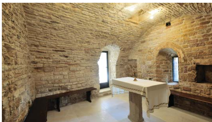
Cripta a lavori ultimati